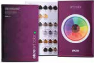
Artcolor Color Chart