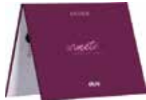
Artmetal Color Chart