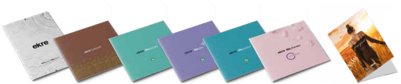
Brochure life.pure & life.force