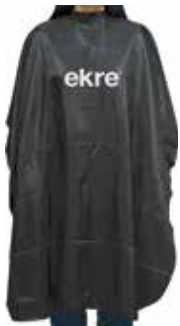
Hair Cutting Cape