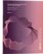
Lightkrome Color Chart