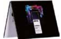
Switch On Color Chart